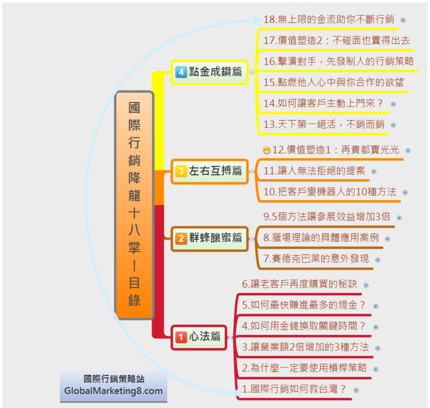
圖二：「國際行銷降龍 18 掌」目錄